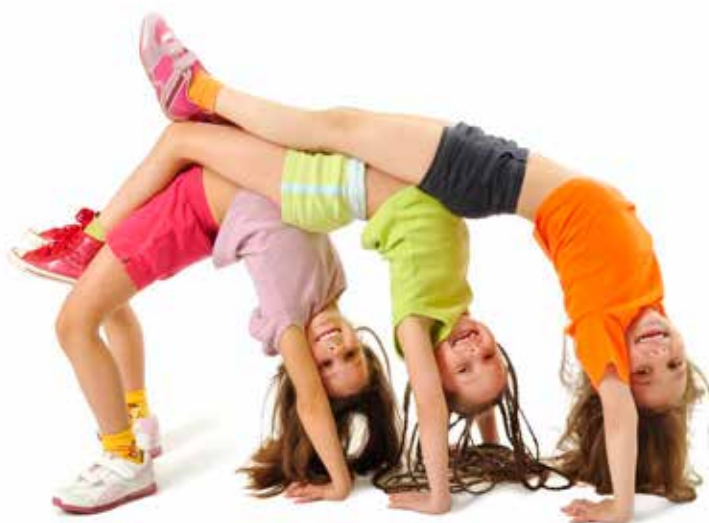
BROEN - bygger bro for udsatte børn (modelfoto)